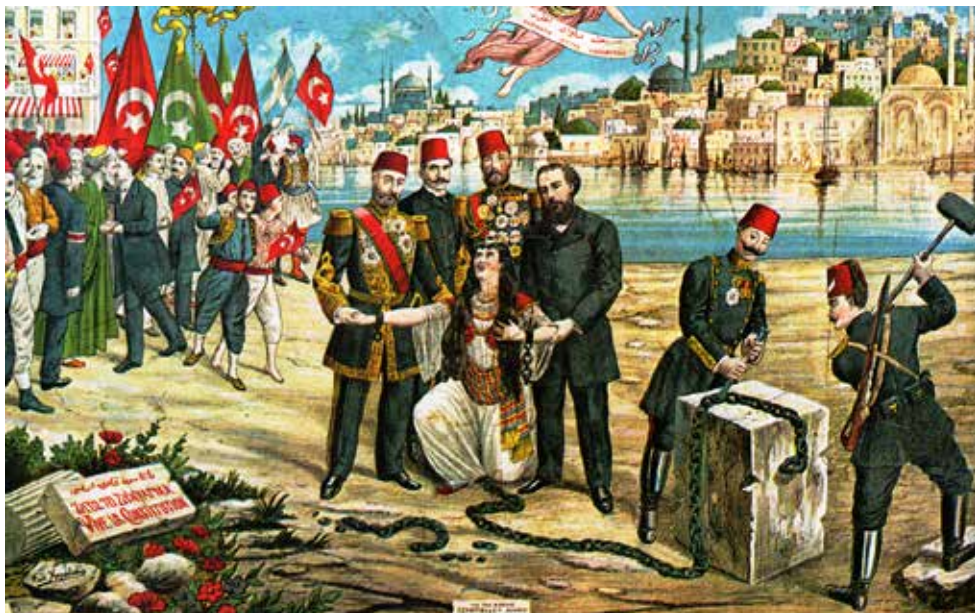
מעו'מאנית לתורכית. הסיסמה 'חירות, שוויון, אחווה' מתנוססת מעל משחוריה של תורכיה מבלי האימפריה העו'מאנית במהפכת התורכים הצעירים, סושי'ס נריסטידיס, 1908