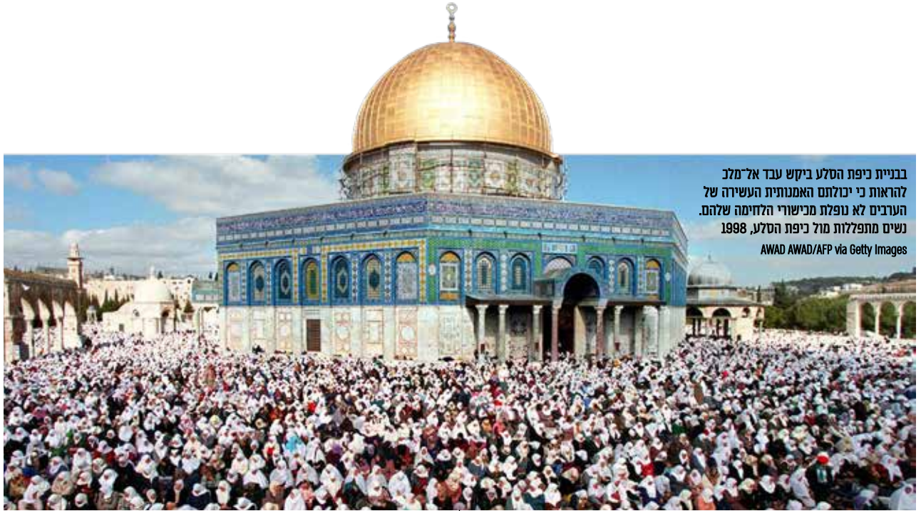
בבניית כיפת הסלע ביקש עבד אל-מלכ להראות כי יכולתם האמנותית העשירה של הערבים לא נופלת מבישורי הלחימה שלהם. נשים מתפללות מול כיפת הסלע, 1998.