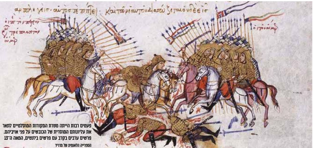
פעמים רבות הייתה משרת המקורות המוסלמיים לתאר את עליונותם המוסרית של הכובשים על פני אויביהם. פרשים ערבים בקרב עם פרשים ביזנטיים, המאה ה-13 הספרייה הלאומית של מדיד

אפשר לראות במסורות על ביקורו של הח'ליף השני עומר בן אל-ח'טאב בירושלים לאחר כיבושה ניסיון להעלות את מעמדה הדתי בימי האומיים. דמותו של הח'ליף עומר כמי שעמד בראש כיבוש העיר מציגה אותו ככובש האידיאלי ואת כיבוש העיר ירושלים כהתגשמות רעיון יהודי משיחי, ובכך כמעניק לאסלאם לגיטימציה על החזקה בירושלים.